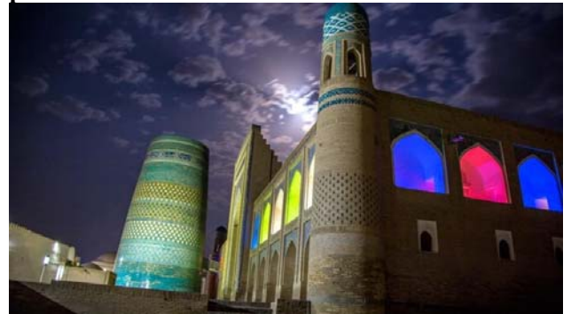
Moschee und Medrese von Chiwa

Besonderes Interesse weckt die Magok-i-Attari Moschee, eine der ältesten der Stadt, die an der Stelle eines früheren zoroastrischen Tempels errichtet wurde. Ferner sehen wir Medresen, Handelsgewölbe , einen Hammam , eine alte jüdische Synagoge und Puppenwerkstatt .