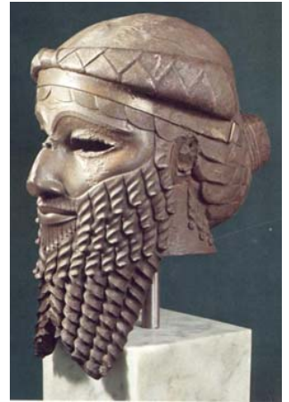
Alexander der Große und die Sassaniden bestimmten die Kultur des Landes

Staatssprache ist das Usbekische, aber über die Hälfte beherrscht Russisch, Sprache der Bildung und Wirtschaft. In den Medresen (Koranschulen) erfolgt der Unterricht auf Arabisch und 50% der Schüler lernen Deutsch, das sie bei der verbliebenen Minderheit im Lande praktizieren können. Inzwischen steigt man vom kyrillischen auf das lateinische Alphabet an.