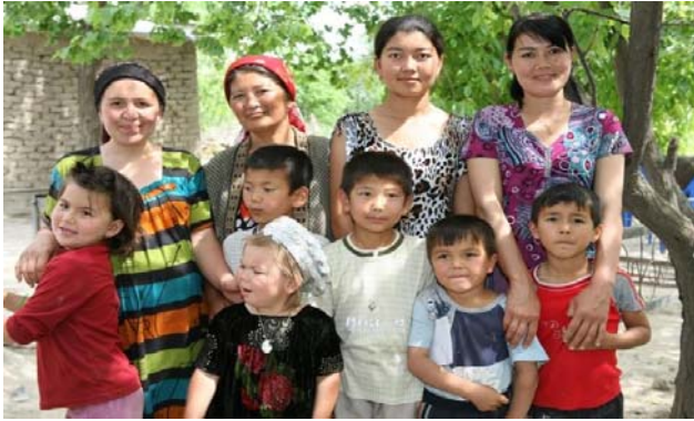
Herzliche Begrüßung im Dorf Mitán