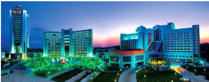
Taschkent gilt als Labor für alte und neue Architektur

Gegen Abend fliegen wir nach Urgentsch und fahren mit dem Bus weiter nach Chiwa. (ca. 35km)