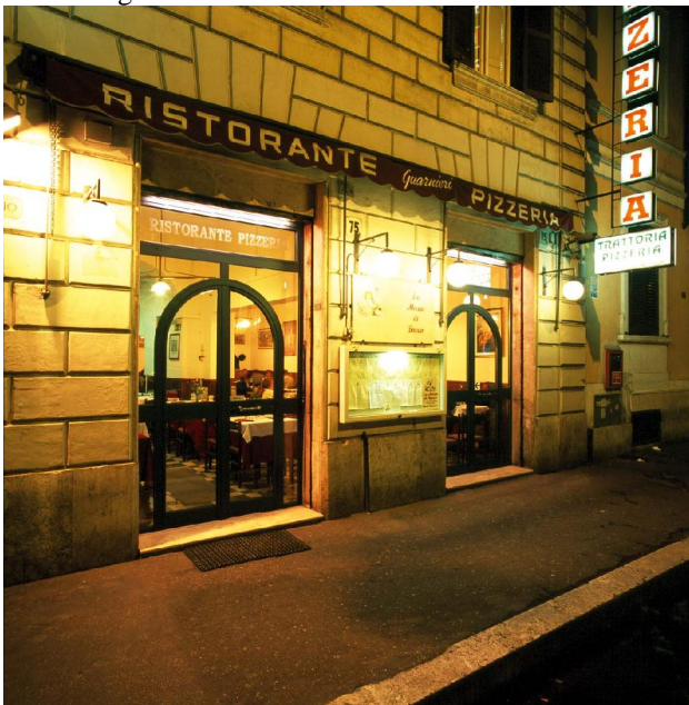
Ristorante Mensa di Bacco

Für Vegetarier gibt es statt des Hauptgerichtes einen Käseteller, für Moslems werden Alternativen zu Schweinefleisch angeboten.