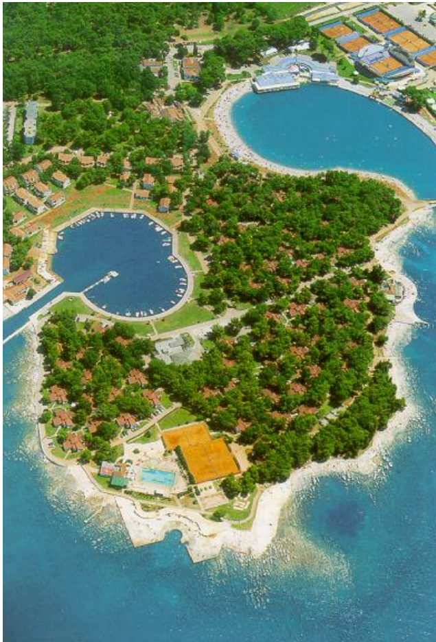
Die Bungalows liegen in dem Wäldchen auf der Halbinsel.